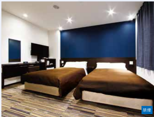
■ ユニバーサルツインルーム [約23㎡] セミダブルベッド [120cm] 2台