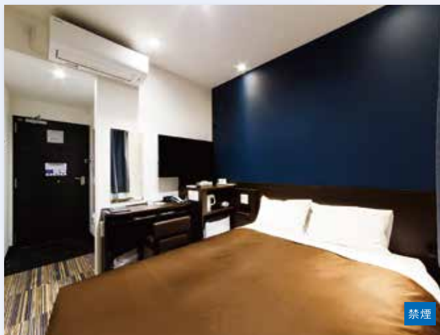
■ ダブルルーム [約12㎡] ダブルベッド [140cm]