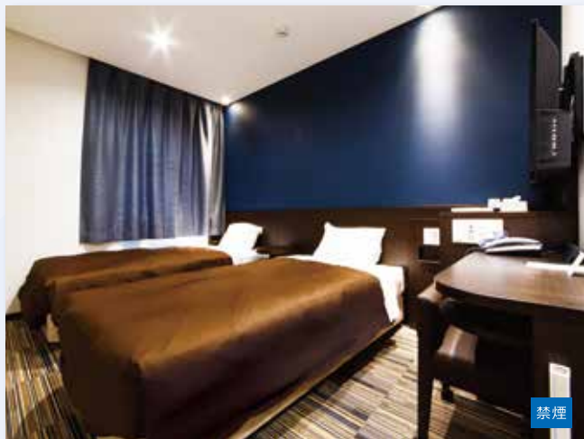
■ ツインルーム [約15㎡] シングルベッド [100cm] 2台